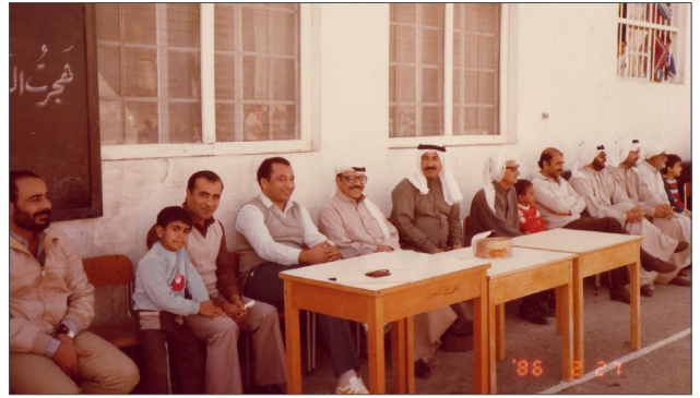
■ مدرسو مدرسة الخميس، التقطت الصورة بتاريخ ١٩٨٦/٢/٢٧