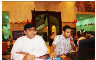
■ مسابقة أحمد حسن

• عدم التواصل بين أفراد الجمعية العمومية مع اللجنة من حيث التوجيه والنصح وتقديم