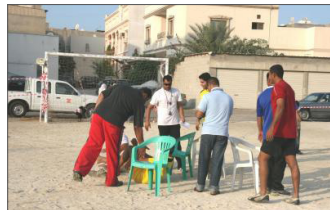
■ مهرجان عيد الأضحى الترفيهي