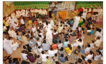
■ إحدى احتفالات المآتم