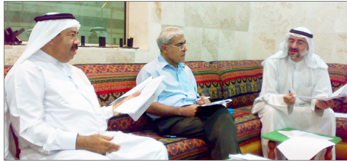
■ جانب من إجتماع لجنة الدستور