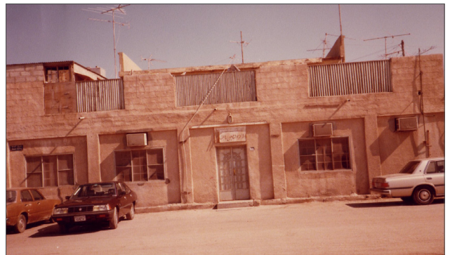
■ مركز الخميس الصحي القديم، ١٩٨٦/١/٦