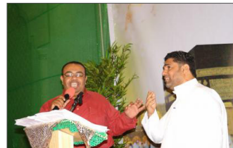
■ احتفال المآتم بمولد الإمام علي (ع)