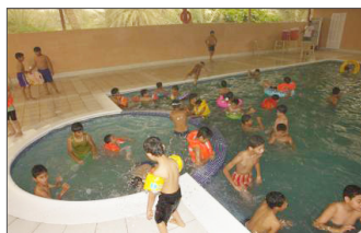
رحلة ترفيهية لطلاب المآتم