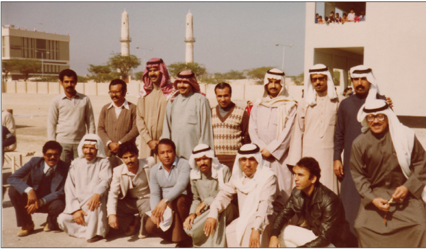
■ مدرسو مدرسة الخميس، التقطت الصورة بتاريخ ١٩٨٢/١٢/١٩