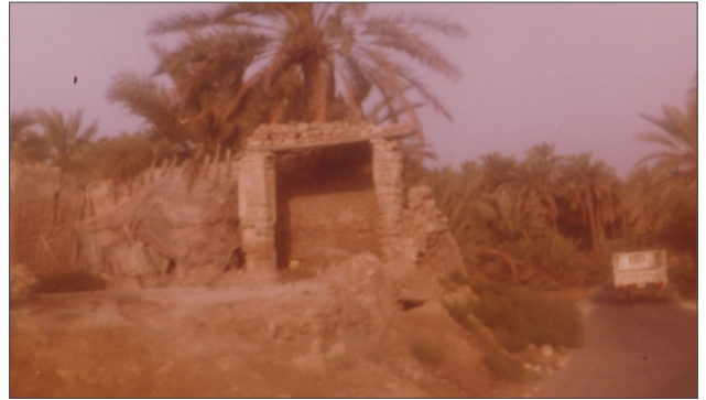
■ مسجد عبد المسلسل، التقطت الصورة بتاريخ ١٩٨٣/٦/٤