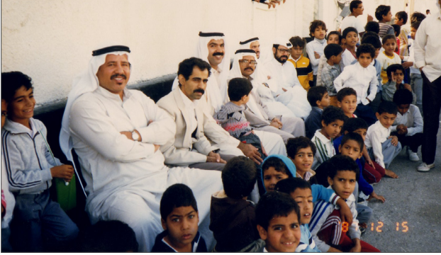
■ المدرسين في مدرسة الخميس، التقطت الصورة بتاريخ ١٩٨٧/١٢/١٥